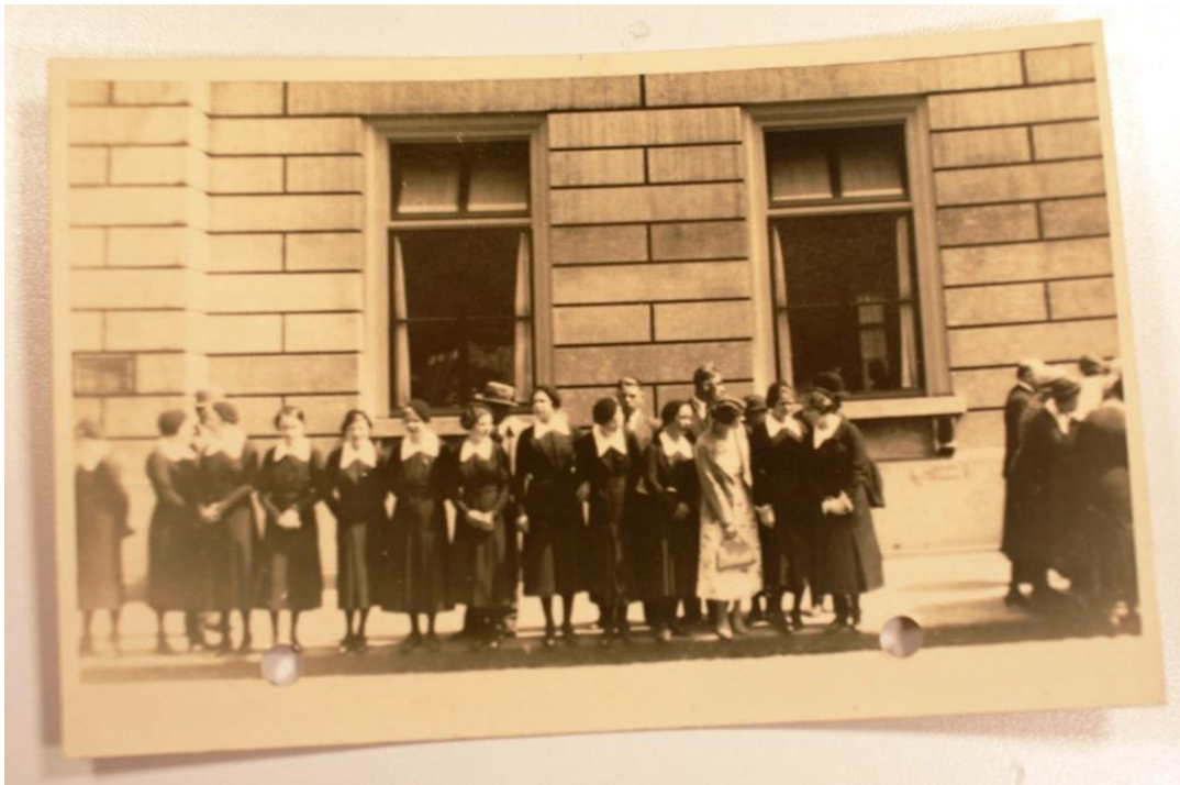
Juli 1936. 'Verpleegden' van de Beide Weeshuizen, 'tijdens voorbijtrekken van H.M. de Koningin.'