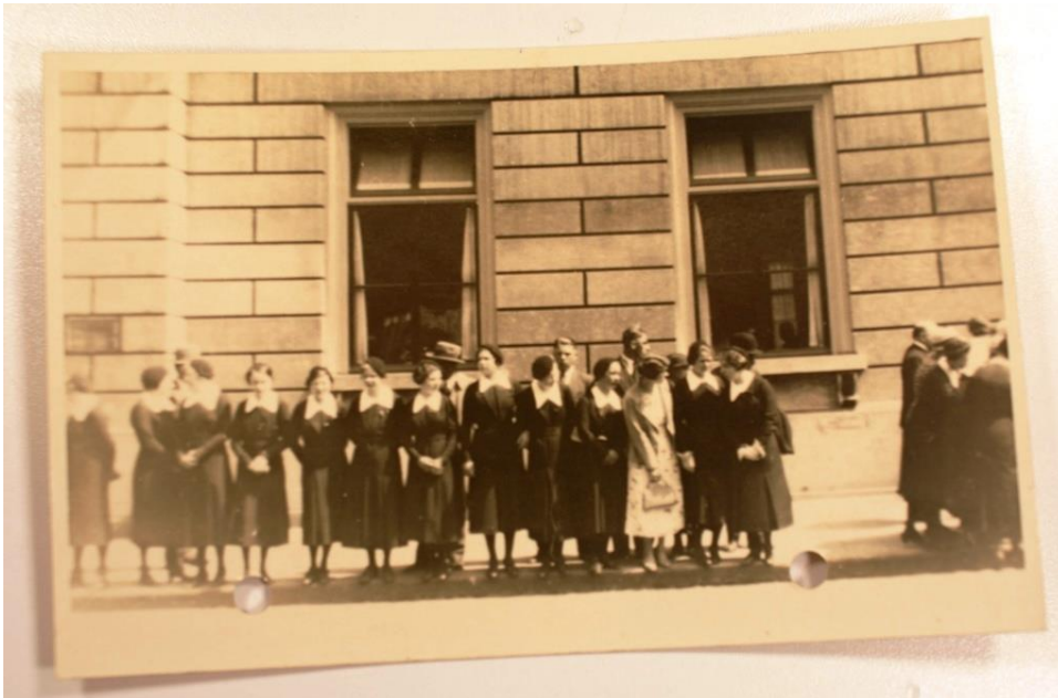
Juli 1936. 'Verpleegden' van de Beide Weeshuizen, 'tijdens voorbijtrekken van H.M. de Koningin.'