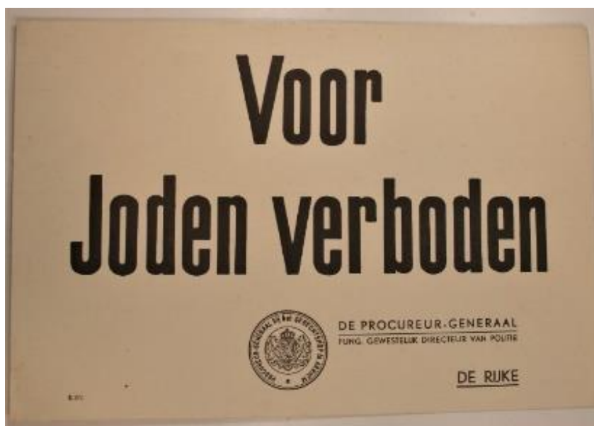
Afbeelding 1. Kartonnen bord met de tekst: "Voor Joden verboden", opgehangen aan de hoofdingang van Stichting Huize St. Anna.

Tijdens de Duitse bezetting hingen ze ook in Nijmegen: de borden 'Voor Joden verboden', waarmee Joodse inwoners geweerd werden uit de openbare ruimte, uit parken, cafés, restaurants, hotels, pensions, bioscopen, schouwburgen, sportvelden, zwembaden, badhuizen, en wat al niet. 2 In Nijmegen moeten er behoorlijk veel te zien zijn geweest, in ieder geval meer dan honderd. 3 Des te vreemder is het dat er geen enkele foto van deze borden in Nijmegen bewaard lijkt te zijn gebleven. Zoeken op internet levert tal van borden op in allerlei plaatsen, niet in Nijmegen. Ook in het Regionaal Archief Nijmegen konden we geen foto's vinden. Wel troffen we daar twee (kartonnen) borden aan: een dat, volgens de beschrijving van het archief, begin januari 1942 is opgehangen aan de hoofdingang van Huize St. Anna, het andere hing bij de ingang van het Burgerghasthuis in de Molenstraat. 4