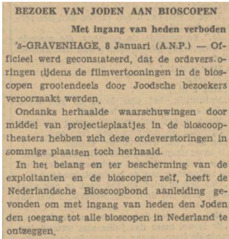
Afbeelding 2. De Provinciale Geldersche en Nijmeegsche Courant van 8 januari 1941 publiceert de bekendmaking van de Bioscoopbond waarin deze de maatregel om Joden de toegang te weigeren 'motiveert'.