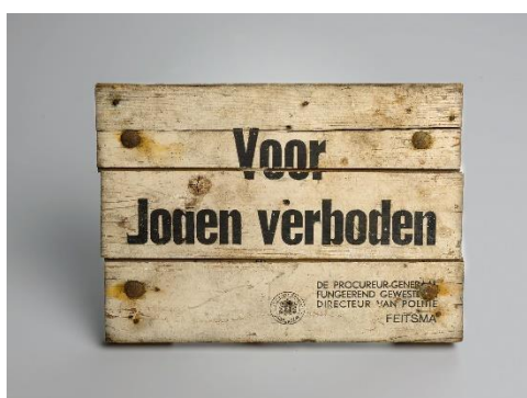
Afbeelding 6. Bord, model voor het ressort Amsterdam. Elke ressort had het stempel van de eigen procureur-generaal. Die van het ressort Arnhem, waar Nijmegen onder viel, had het stempel van De Rijke (vgl. afbeelding 1).

2e. een opgave van de in Uw gemeente gelegen openbare parken, en dierentuinen, openbare sportinrichtingen in de open lucht, zeebaden en andere openbare niet-overdekte zwembaden, openbare markten in de open lucht en slachthuizen, zoomede het aantal houten borden hetwelk ter aanduiding van deze inrichtingen noodig is. 67