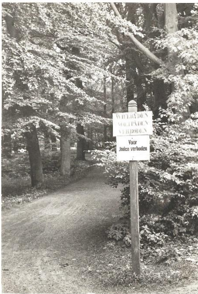
Afbeelding 3. Een bord waarmee Joden toegang tot de Haarlemmerhout (Hendriklaan) wordt ontzegd.