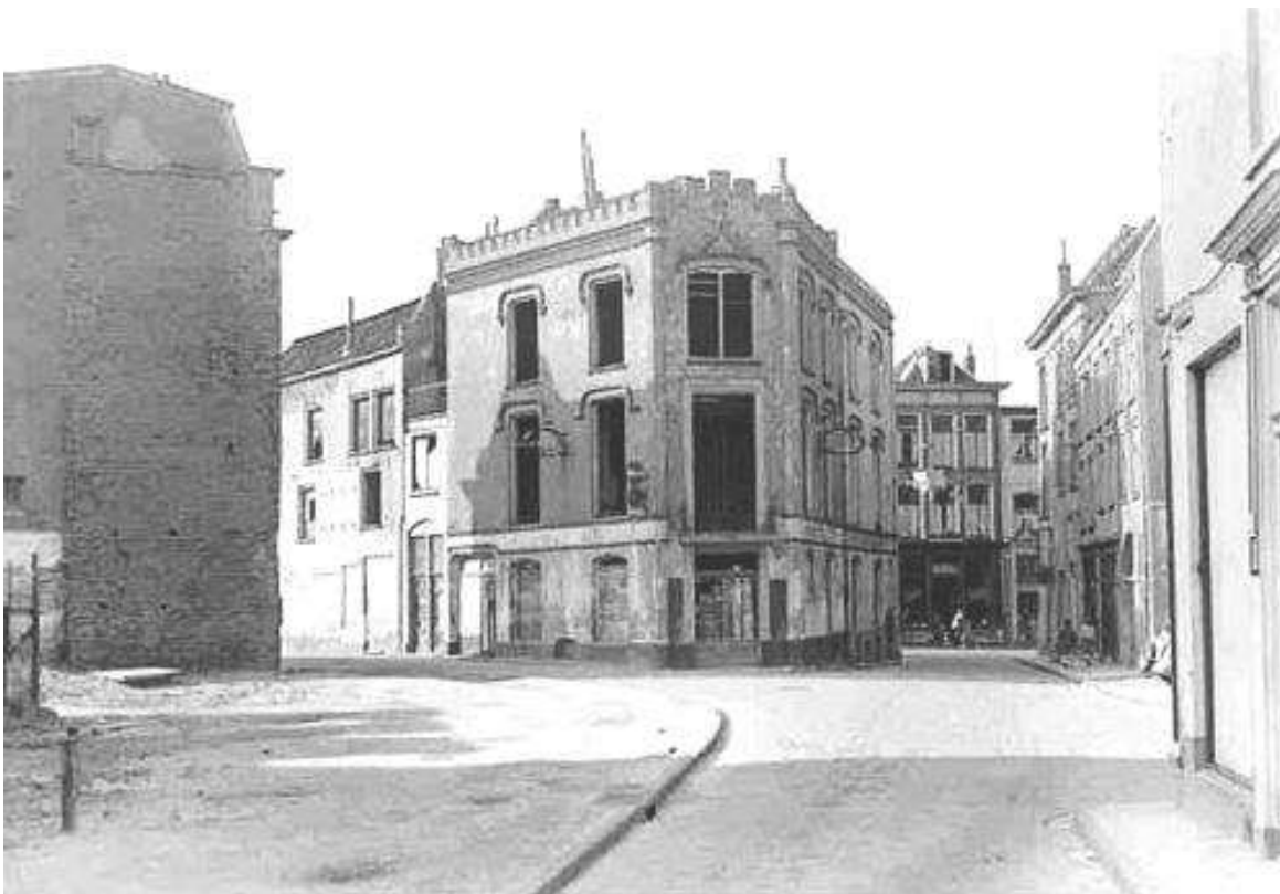
Heuveltje 2, in de rechterstraat aan de linkerkant. Op de achtergrond de Lange Hezelstraat. Waar deze panden stonden tot 1953 is nu het pleintje.