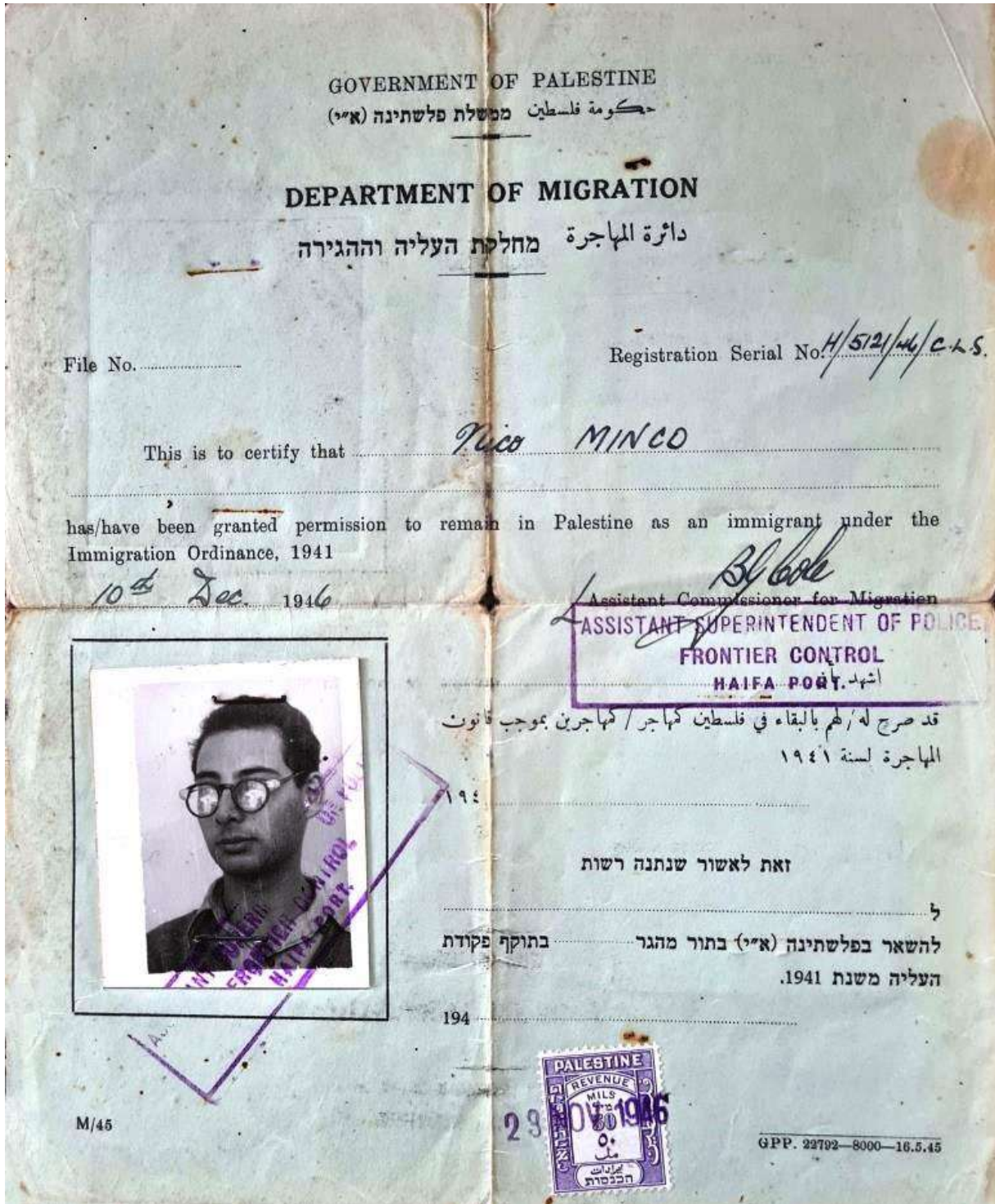
Nathan kreeg uiteindelijk op 23 november 1946 toestemming Palestina in te reizen