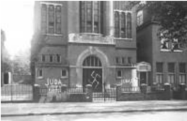
De bekladde synagoge

uitgepikt door agenten van de 'Politieke Dienst', soms ook door hun echtgenoten of zelfs kinderen (die van Wiebe!), en door de genoemde Herfurth. Soms veroorzaakten deze strooptochten ook wel onderlinge rivaliteit.