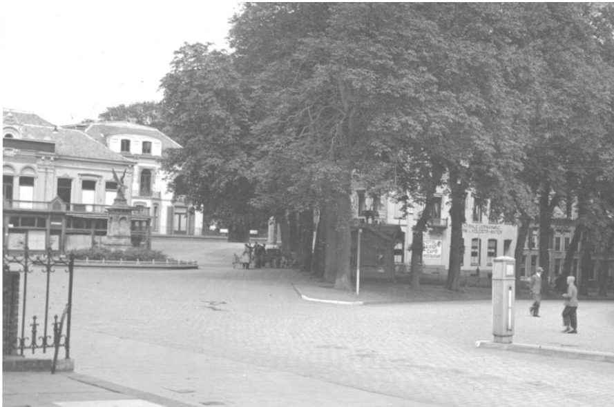
Links op de foto, achter het standbeeld, het gebouw van 'Unitas'. Rechts de Voerweg.