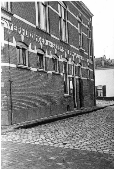
Firma Van Wezel, Waalkade, bij de toenmalige Vosstraat.