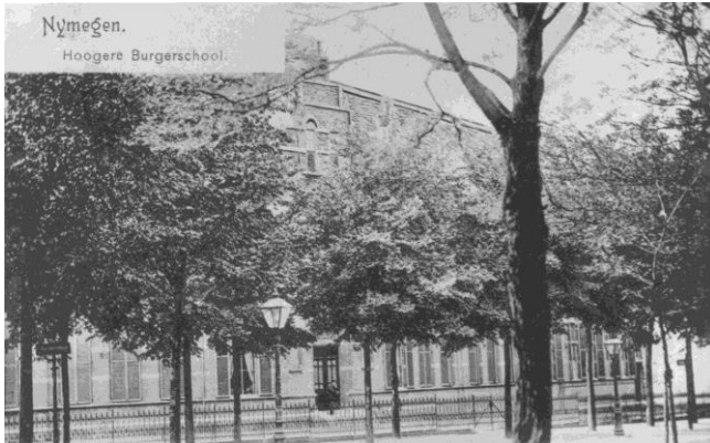
De HBS in 1930

licht als een kind. Dadelijk stonden enigen op om plaats te maken. Op dekens werd het ongelukkige wezen dat meer dood was dan levend neergelegd' 38