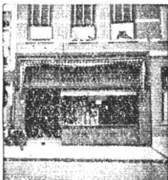
72 DE PAPAVER Wol, Handschoenen, Kousen, enz. v. Welderenstraat 108.